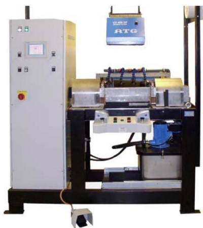
Kompaktní UNIMAG 400 provedení s dotykovou obrazovkou