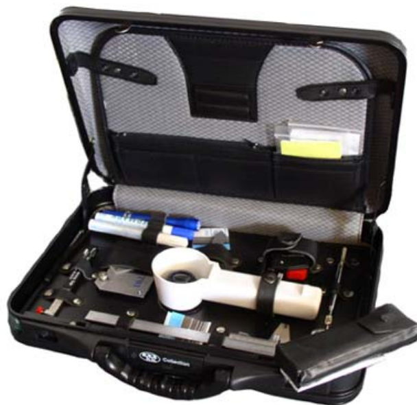
Katalogové číslo: 7625-11-00

V případě zájmu zákazníka jsme schopni nabídnout i inspekční kufřík s individuálně upraveným obsahem a cenou. Skladem je pouze kompletní inspekční kufřík.